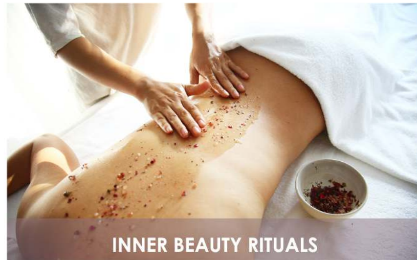
INNER BEAUTY RITUALS

アクティブバンパーロールアウト (50分) 暖かいデトックスセラピー。温められた竹の棒を使い、主に背中と足のリンパの流れを良くします。強いプレッシャーがデトックスと免疫力を高める効果があります。