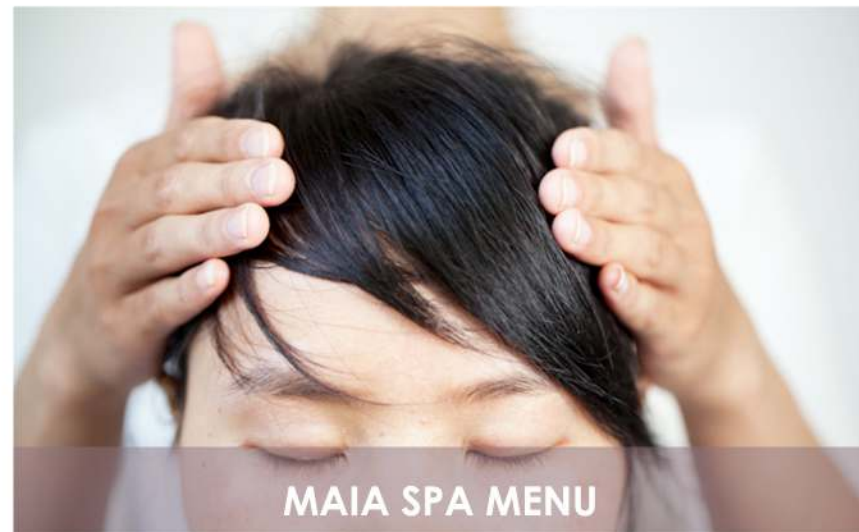
MAIA SPA MENU

スパのフィロソフィーは、皆さまのウェルビーイングのために、私たち心のもった素晴らしいヒーリングセラピーから注意深く考えて作られました。ホリスティックセラピーは、霊気ヒーリングに伝統的な治療的トリートメント、アロマセラピー、そしてインハウス薬局でのハンドメイドのスクラブやラップを融合させています。