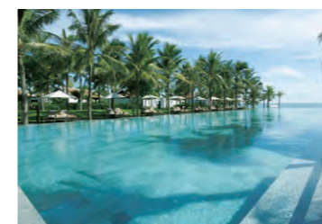
THE NAM HAI HOI AN, VIETNAM