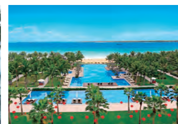
VINPEARL RESORT & SPA